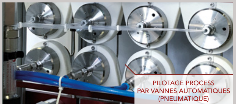
PILOTAGE PROCESS PAR VANNES AUTOMATIQUES (PNEUMATIQUE)

ACEI est experte dans la conception d'équipements de test polyvalents et innovants. Les actionneurs dynamiques et les capteurs haute précision intégrés sont contrôlés par des logiciels évolués dédiés.