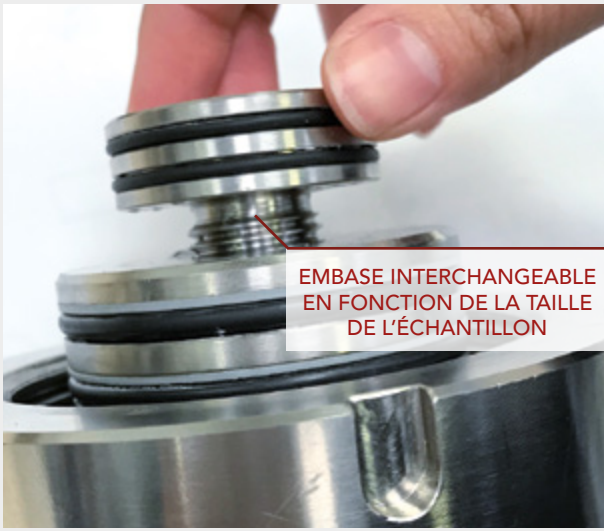
EMBASE INTERCHANGEABLE EN FONCTION DE LA TAILLE DE L'ÉCHANTILLON